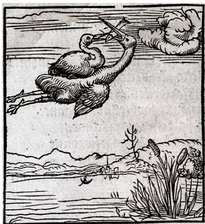
Emblème GRATIAM REFERENDAM, Andrea Alciati, Emblematum libellus , Paris, 1534, p.9

Fort de son expérience dans l'étude des relations texte-image à la période moderne, et en particulier l'étude de l'expression figurée dans ses multiples formes, le Centre d'analyse culturelle de la première modernité (GEMCA) organise une École de printemps, à l'UCLouvain (Belgique) du 20 au 24 avril 2026 , visant à rendre ce corpus plus familier et plus accessible tout comme les diverses méthodes pour l'approcher – un corpus dont la connaissance et la compréhension sont essentielles à toute recherche sur la période moderne pour qui veut en saisir les enjeux épistémologiques profonds ainsi que certaines de ses singularités.