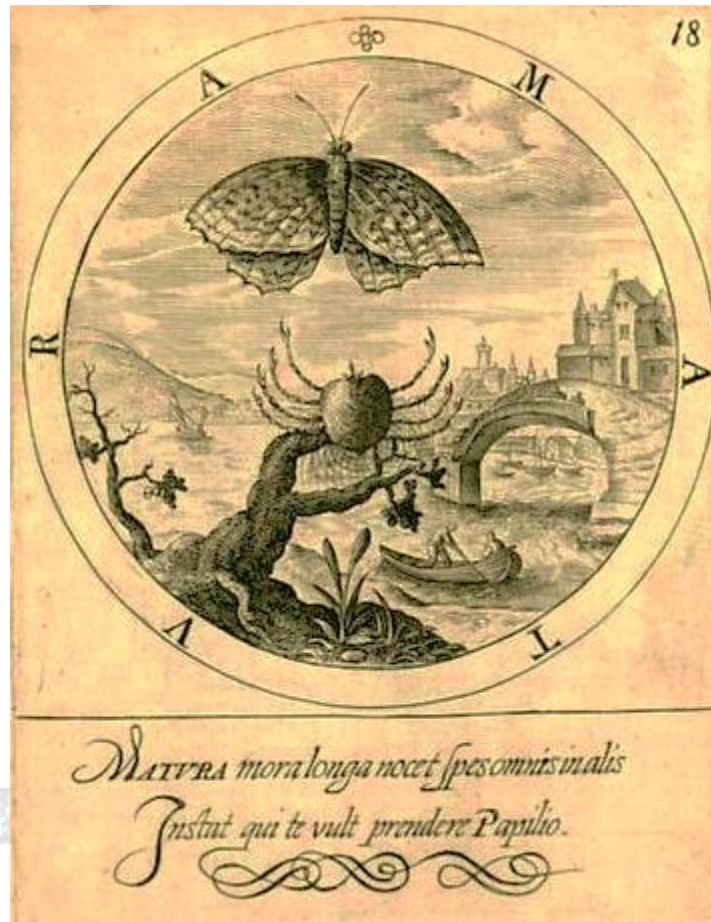
Emblème MATURA, Gabriel Rollenhagen, Nucleus emblematum selectissimorumquae Itali vulgo impressas vocant , Colonie, 1611